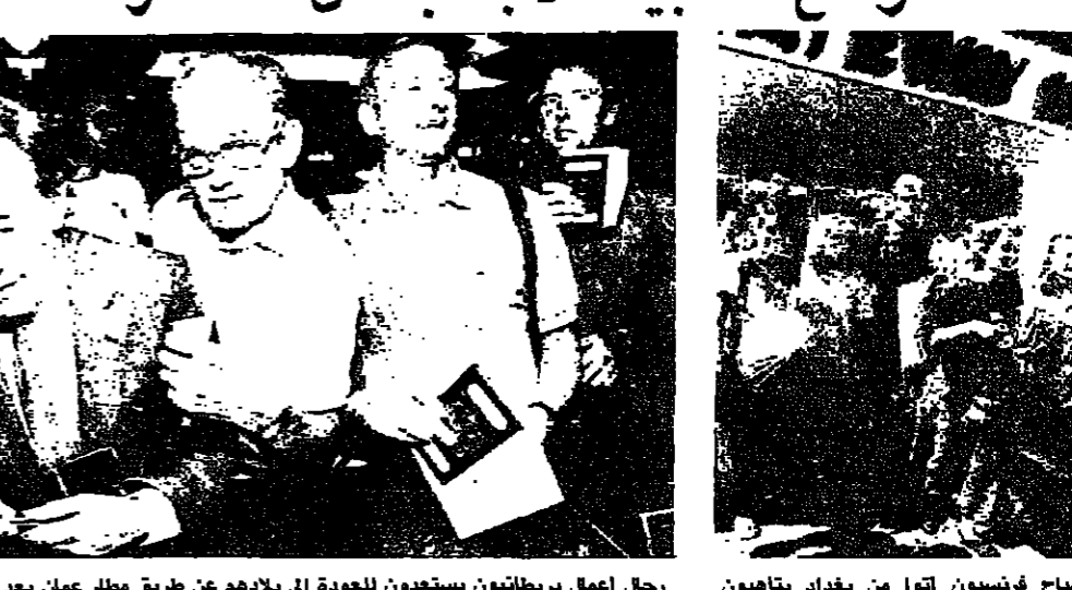
رجال عمل بريطانيون يستعدون للعودة الى بلادهم عن طريق مطار عمان بعد مغادرتهم العراق.

قررت اغلاق الحدود، وان هلك شخصاً ما زالوا يبيرونها. وقالت مراسلة رويترز، ان سيارات محملة بمعدات عراقية في الكويت ما زالت تدير الحدود، ولكن لم يعد هناك فيها يهودي من الغربيين. الذين عبروا الحدود باعداد صغيرة في السبق.